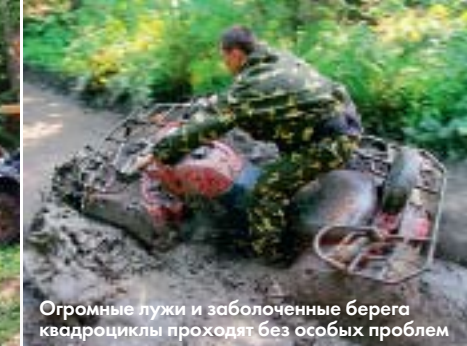
Огромные лужи и заболоченные берега квадроциклы проходят без особых проблем