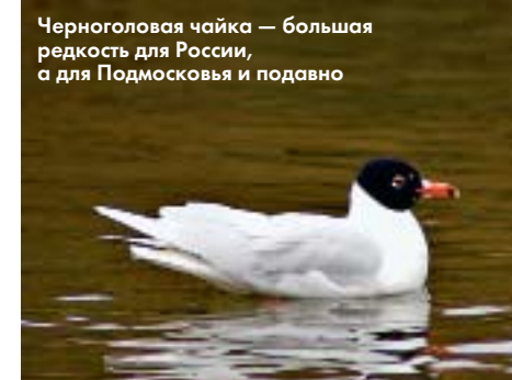
Черноголовая чайка — большая редкость для России, а для Подмосковья и подавно