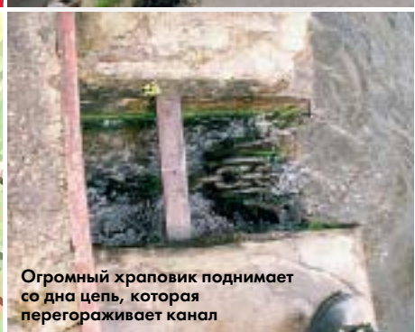
Огромный храповик поднимает со дна цепь, которая перегораживает канал