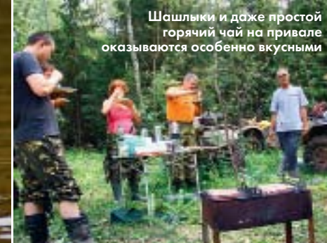
Шашлыки и даже простой горячий чай на привале оказываются особенно вкусными