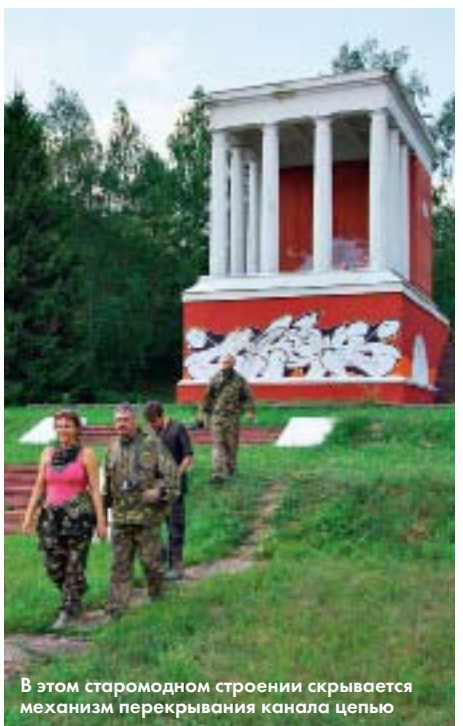
В этом старомодном строении скрывается механизм перекрытия канала цепью

Если присмотреться, в подмосковных лесах можно найти много грунтовых дорожек с непонятной поначалу колеи. Но стоит самому хоть полдня покататься на квадрае, его след начнешь узнавать без труда