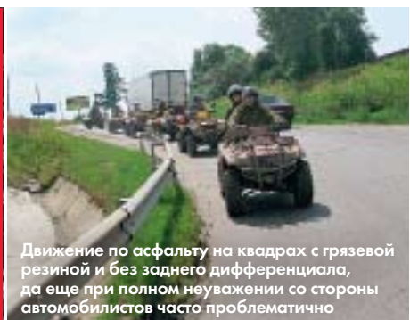
Движение по асфальту на квадрах с грязевой резиной и без заднего дифференциала, да еще при полном неуважении со стороны автомобилистов часто проблематично